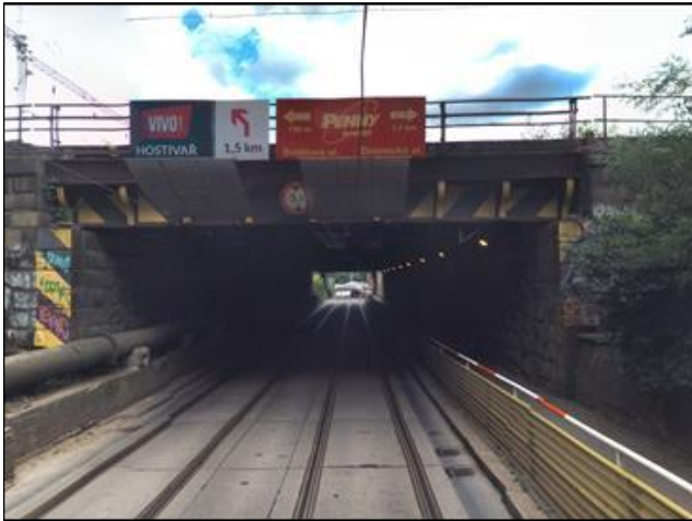
Původní podjezd pod 17 kolejemi

Nový přestupní uzel vlaků a mhd, železniční stanice na mostě, přestavba a rozšíření komunikace