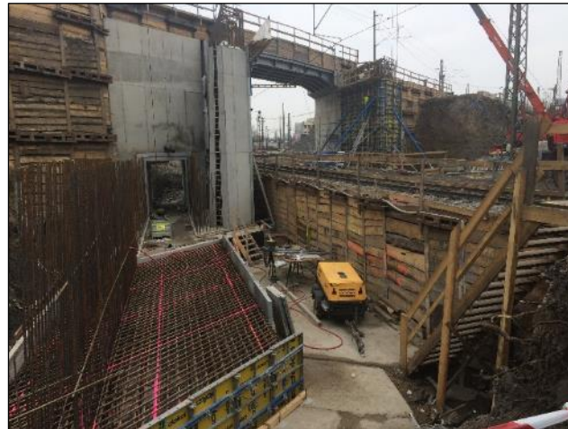
Výstavba za provozu 1 koleje na mostě i pod mostem