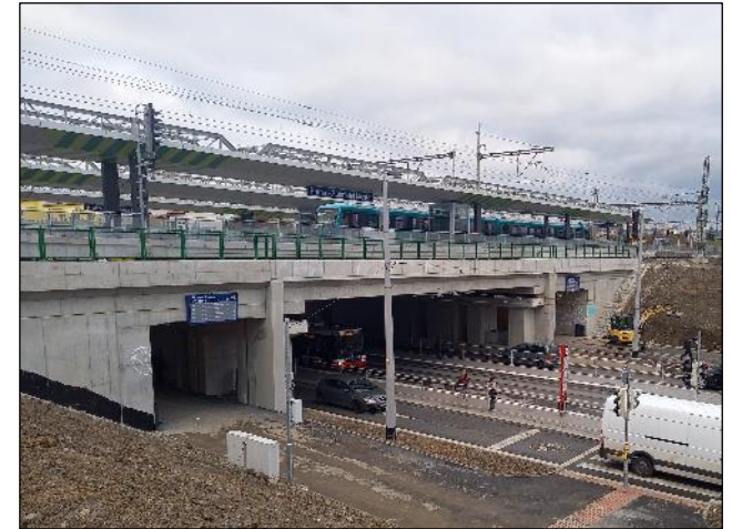
Pohled na nový přestupní uzel