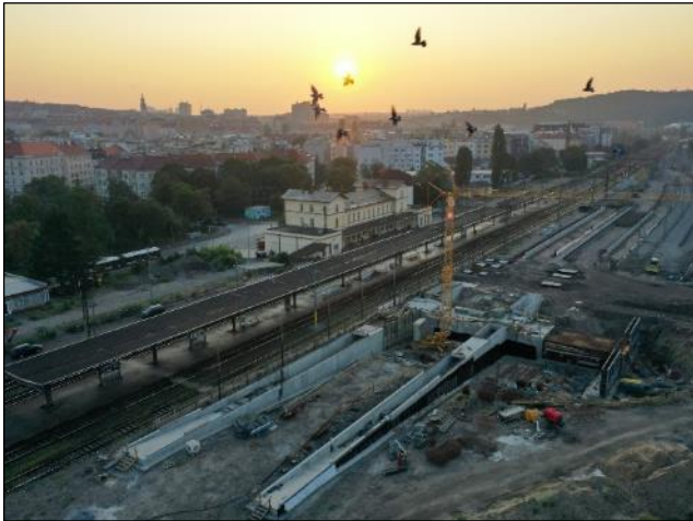
Výstavba podchodu na nádraží Vršovice

Stavba nového podchodu a nástupišť za provozu, provizorní lávka pro cestující, rekonstrukce 2 mostů