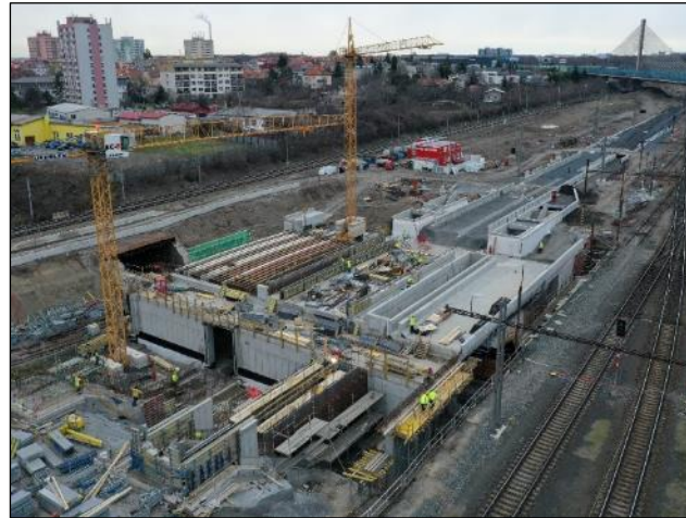
Stavba v plném běhu