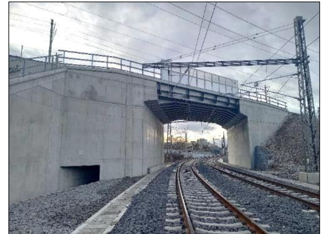
Nový dokončený most