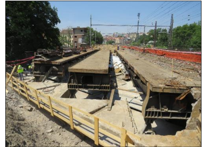
Atypická konstrukce mostu „Otkarova“