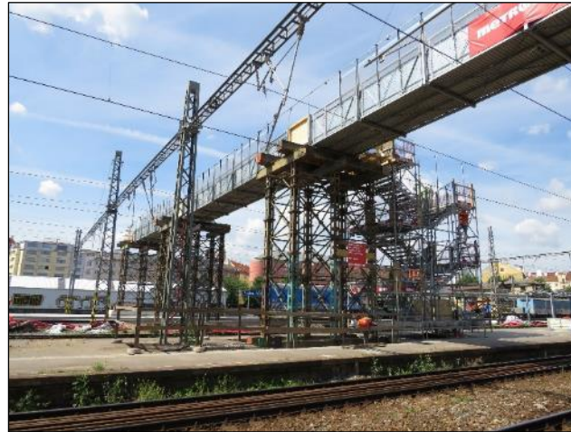
Provizorní lávka pro cestující na nástupiště